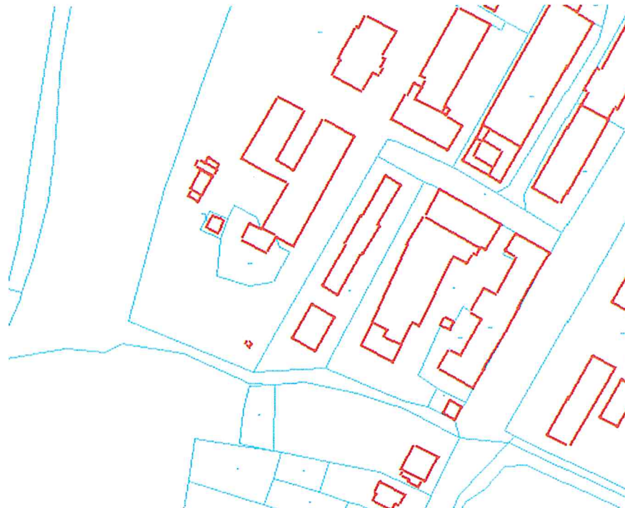
Fot. 2: mapa